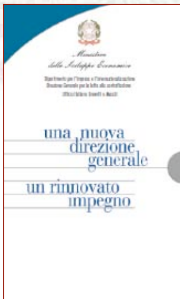
Brochure Direzione Generale per la lotta alla contraffazione Ufficio Italiano Brevetti e Marchi