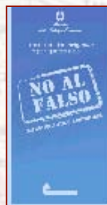
Brochure "NO AL FALSO"