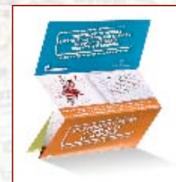
Brochure "La qualità non si tratta"