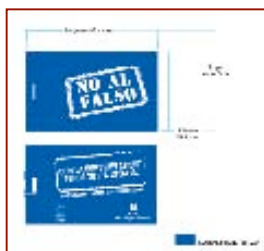
Chiavetta USB slime