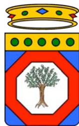
Regione Puglia Assessorato allo Sviluppo Economico