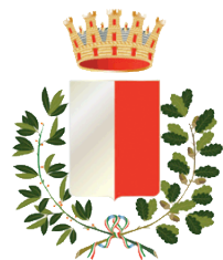
Comune di Bari