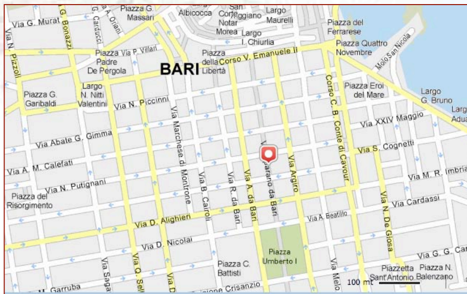
Bari: all'incrocio tra via Putignani e via Sparano.

Localizzazione dei gazebo dove verrà distribuito, nelle città di Bari e di Brindisi nei giorni 21, 22 e 23 dicembre p.v., il materiale informativo/promozionale predisposto dalla Direzione Generale per la lotta alla contraffazione – Ufficio Italiano Brevetti e Marchi in occasione della campagna di sensibilizzazione realizzata in collaborazione con ANCI Puglia.