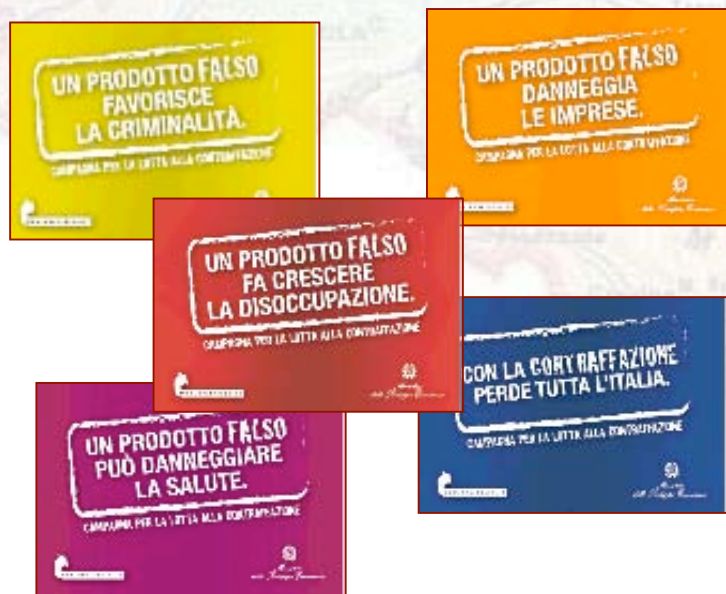
Manifesti slogan contraffazione