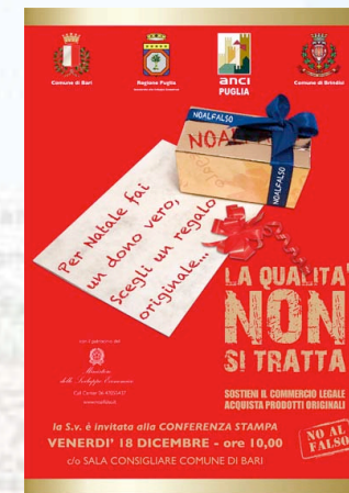
Manifesti "La qualità non si tratta"